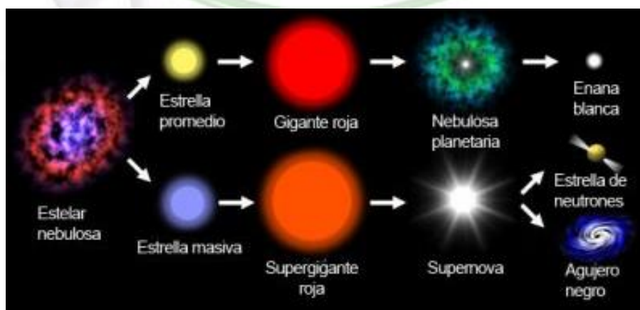
Ilustración 1. Ciclo de la vida de una estrella

3. Todas las palabras de la imagen son agudas, llanas o esdrújulas: _____